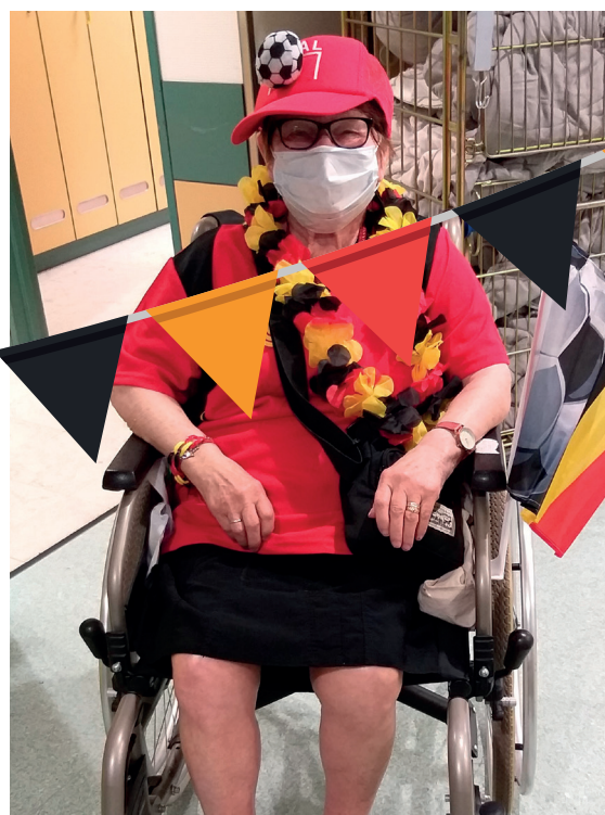
Nous aussi on croit en eux.