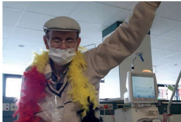
Nos supporters des Diables Rouges.