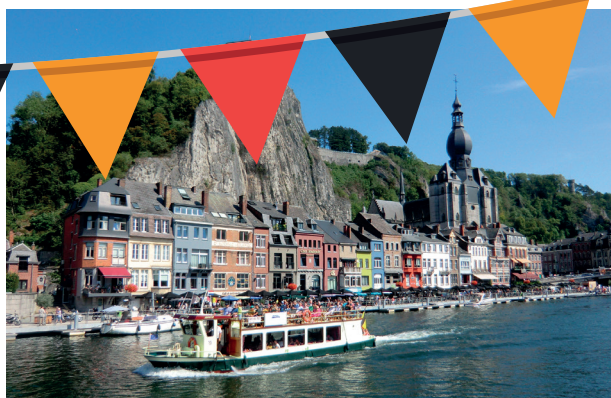
Séjours à Dinant.